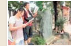
国語科教育学研究 I 国語科教育の内容や方法を学び、今日の国語科教育における教材開発の観点や方法について考える授業です。