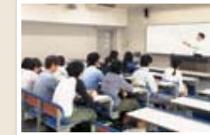
日本語学研究 I 日本語学の基礎について学び、国語科教材の作成について考えることができます。