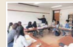
国語科教育学演習 I 国語科教育の基礎理論を学び、卒業論文に必要な研究発表能力を身につけるゼミ形式の授業です。