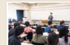
中等教科教育法 I (国語) 中学校の国語科教員として求められる基礎的知識や技能を学ぶ授業です。