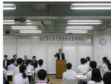
<開講式当日の様子>